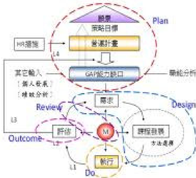
圖 1: ttqs 訓練品質系統