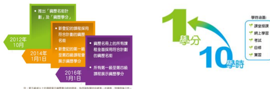
圖 1-資歷學分暨學習時數圖

資歷學分量度資歷的學習量。資歷學分是資歷架構的「通用貨幣」，學員透過資歷學分得以了解完成學習並達致相關資歷的學習成果而需付出的努力及時間。資歷學分表示學習時數(即學時)。在資歷架構下，一個資歷學分相當於十個學時，這考慮到一般學員在所有學習模式下可能需要的總學習時數，包括上課、導修課、實驗、工作坊實習、在圖書館或家中自學，以及評估或考試等。